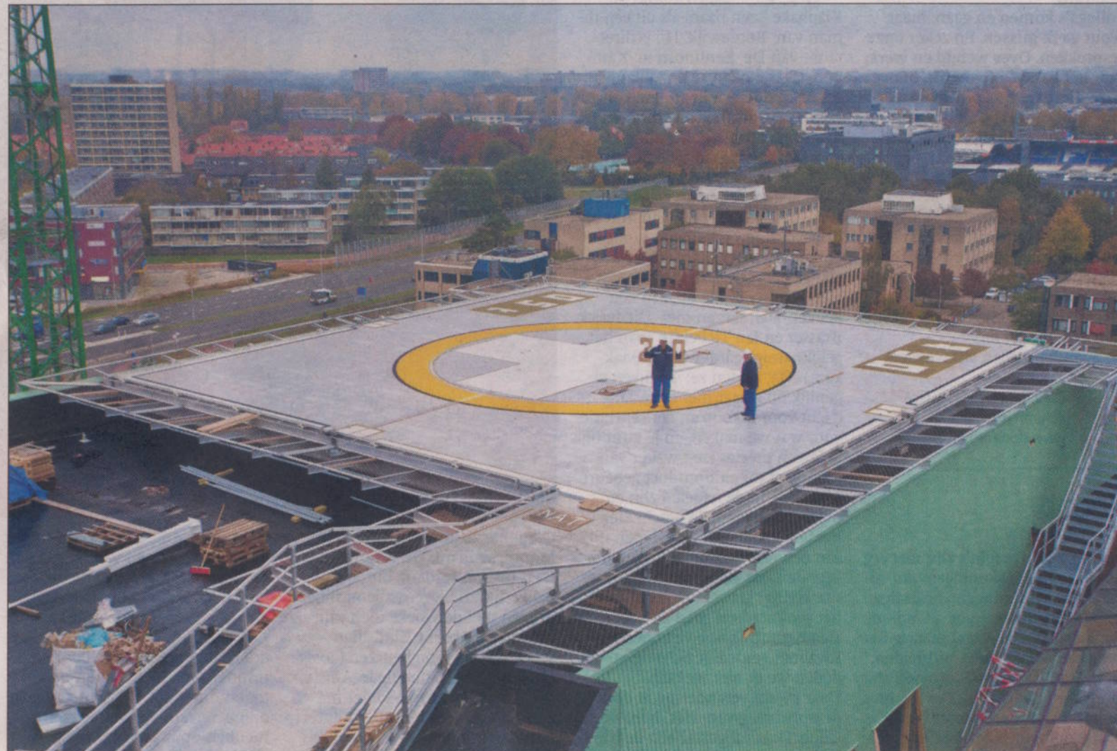
Schilders werken aan de belijning van het helikopterdek van de Isala klinieken met de skyline van Zwolle op de achtergrond, vrijdag.