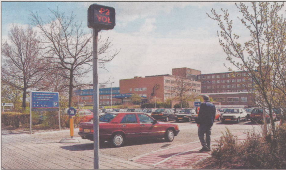
Zo staat de entree van de locatie Sophia - gezien vanaf de Dokter van Heesweg - bij velen in het geheugen gegrift.

Voldoende oriëntatiepunten, volop ramen zodat je binnen contact houdt met de buitenwereld en veel groen en rust. "Onbewust moet je je prettig voelen in het gebouw. Deze architect kan als geen ander de menselijke maat terugbrengen." Het ontwerp van Alberts & Van Huut, bekend van onder meer de ING Bank en de Gasunie, stak er bij de keuze tussen vier ontwerpen met kop en schouders bovenuit. "Het was de sfeer en het gevoel dat klopte. Gelukkig bleek het niet alleen een visueel mooi ontwerp, maar ook functioneel en uiteindelijk financieel haalbaar", blikt Smaling terug. Het ziekenhuis dat Alberts & Van Huut hebben ontworpen bestaat uit vier paviljoens, die bij Isala inmiddels bekend staan als 'vlinders'. Van meet af aan zijn de architecten gevoed met informatie over het ziekenhuis, zodat direct een ontwerp op tafel zou komen dat tot in de details klopt met de Isala klinieken. Zo moesten ze er bijvoorbeeld rekening mee houden dat er tussen bepaalde afdelingen onderlinge relaties bestaan. Gevolg is dat die afdelingen bij elkaar gesitueerd moeten worden. „En het is bijvoorbeeld niet