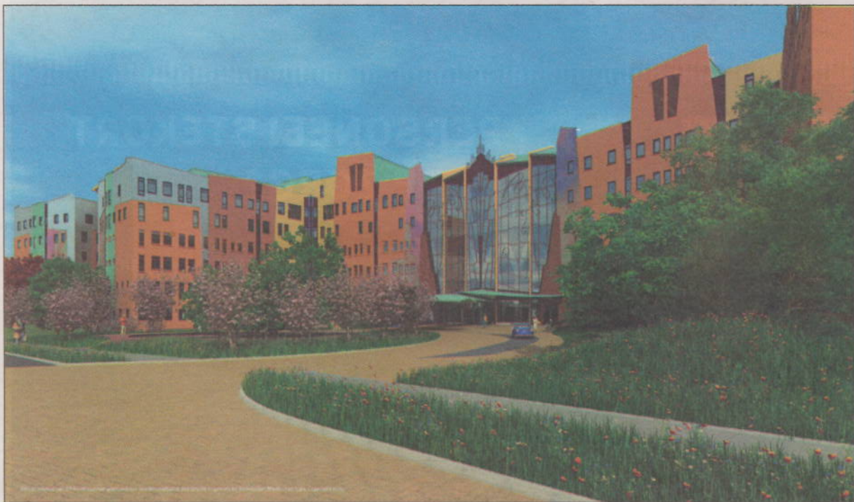
En zo komt de hoofdingang van het nieuwe ziekenhuis - eveneens gezien vanaf de Dokter van Heesweg - eruit te zien. artist impression Isala klinieken